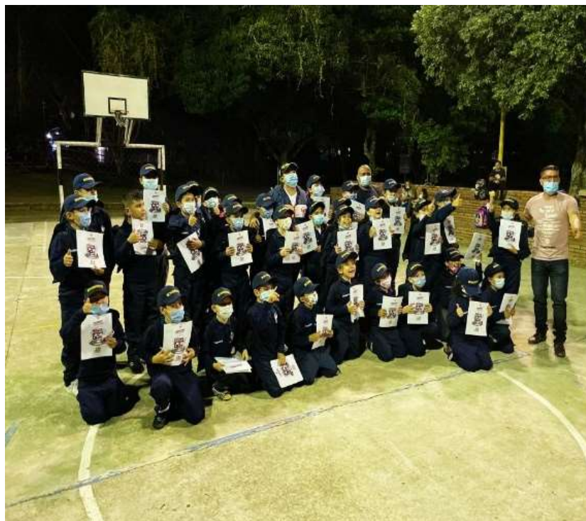
Entrega de uniformes, cartillas, y kit del programa Bomberitos