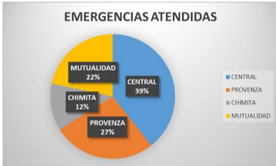
Emergencias período Enero a Marzo 2022

Destacando la mayor participación de la Estación Central que por su ubicación responde a la mayor cantidad de emergencias del municipio de Bucaramanga y de igual forma es la que respalda la operación y apoya a las de las demás estaciones de Bomberos de Bucaramanga.